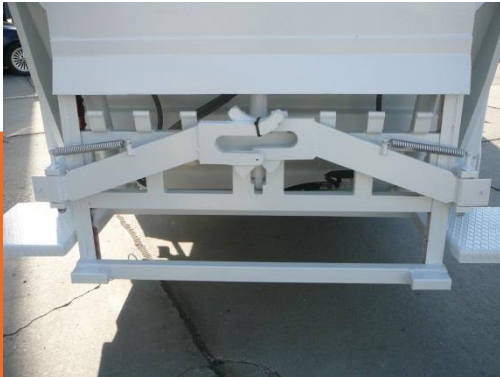
1100+120+240 KONTEYNİR KOLU