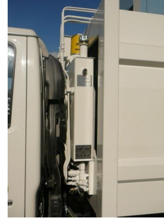
HİDROLİK YAĞ TANKI